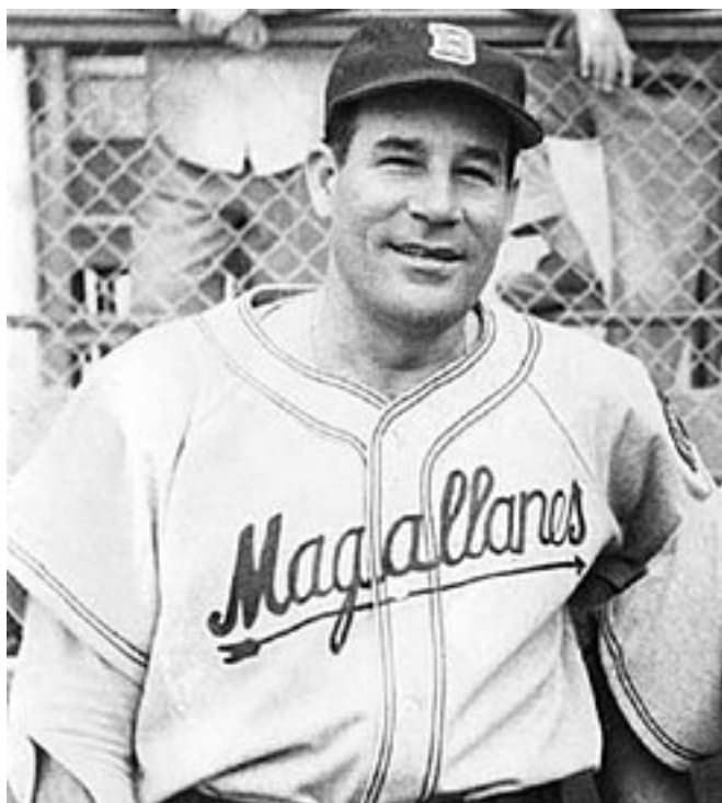
Alejandro Patón Carrasquel debuta en las Grandes Ligas de Béisbol con el equipo Senadores de Washington. Primer Venezolano en Jugar en las Grandes Ligas en la Historia (1939)